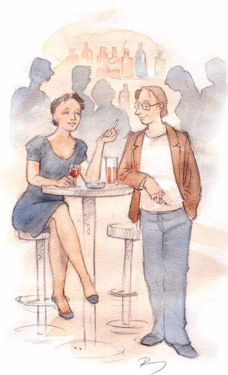
Alkohol och rökning är en dålig kombination – som ännu är tillåten på uteserveringar.

I bröst verkar alkohol på flera sätt. Bland annat påverkar alkohol hormonsystemet, och gör bröstkörtlarna känsligare för östrogen. Andelen körtelvävnad ökar, vilket ökar risken för cancer.